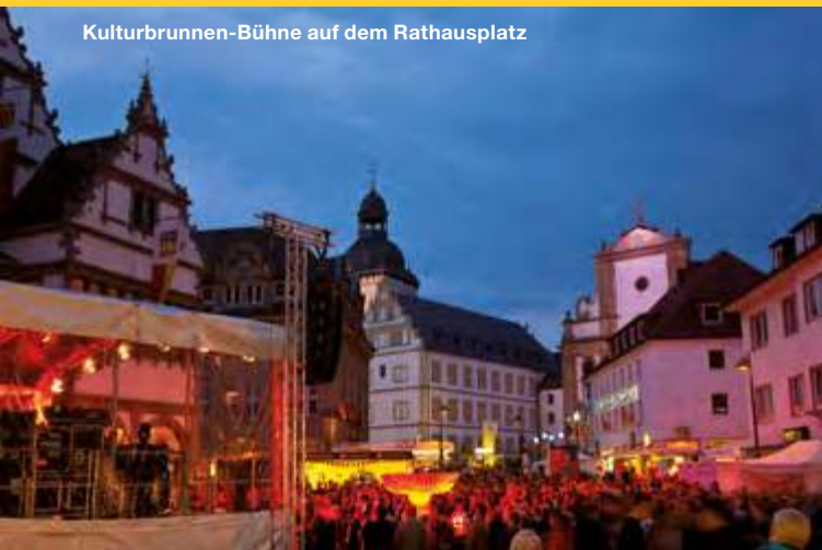
Kulturbrunnen-Bühne auf dem Rathausplatz