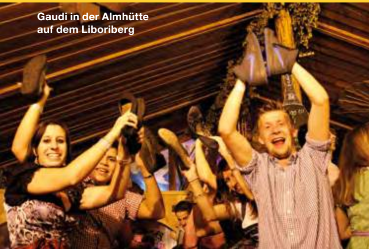
Gaudi in der Almhütte auf dem Liboriberg