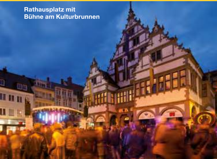
Rathausplatz mit Bühne am Kulturbrunnen

Residenz am Marienplatz: Kitsch – Libori Edition