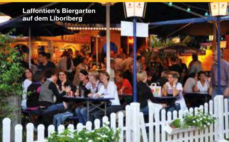
Laffontien's Biergarten auf dem Liboriberg